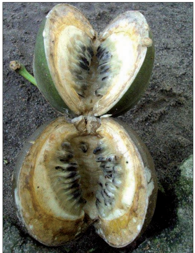
Fig. 2. – Fruit de Tabernaemontana retusa (Lam.) Palacky.

Par la forme et la consistance du fruit, par le testa plissé-ridé et surtout par la présence de la molécule Capuronane (K), la position systématique de cette espèce la rapproche de celles autrefois comprises dans le genre Pandaca . Au cas où il s'avèrerait judicieux de revenir à une conception plus étroite des genres dans ce groupe, cette espèce serait vraisemblablement à classer dans ce genre, endémique de Madagascar.