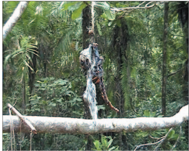
FIGURE 2. Cheirogaleus ravus oublié par le chasseur et dévoré par le Fosa ou Cryptoprocta ferox

L'intervention de l'éducation environnementale est indispensable dans le 'fokontany' d'Andongona et le village d'Anantaka pour sensibiliser les COBA et les populations sur l'importance et l'avantage des ressources forestières, pour qu'ils ne défrichent plus la forêt mais de restaurer plutôt les forêts détruites par les pratiques de cultures sur brûlis et l'installation des pièges à lémuriens. Les appuis techniques seront indispensables pour les associations à élaborer un plan de développement tenant compte de la nécessité de fournir à ses membres des services de qualité, de développer sa viabilité financière. L'application de politiques économiques relatives à satisfaire les besoins quotidiens de chaque membre de l'association est primordiale, c'est-à-dire faire un aménagement de terroir pour permettre les cultures vivrières et d'instaurer l'équilibre des circuits de production et de consommation dans un système économique adéquat. Ce système nécessite la création des conditions améliorant l'offre viable en produits et en services financiers, dans les zones rurales. Donc, ce système nécessite la création d'un projet qui assurera