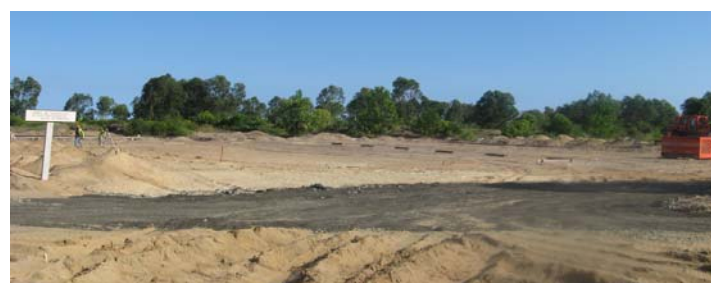
Projet LION ORANGE: Emplacement de la station terminale

De 1998 à mars 2009, 311 permis ont été octroyés dans différents secteurs : agriculture (10), aquaculture (11), biodiversité (4), élevage (3), énergie (29), industrie (65), infrastructure (9), mine (155), projet (8), telecom (2), tourisme (15). Les promoteurs investissent surtout dans les secteurs mine, industrie et énergie.