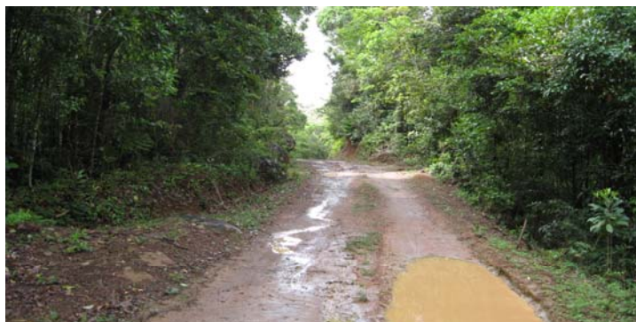
Route à réhabiliter dans le cadre de la mise en oeuvre du projet PIC. Projet à l'intérieur du Parc national d'Andohahela

Les impacts positifs pouvant entraîner des bénéfices pour l'Etat, le promoteur et la population locale sont capitalisés, tandis que les impacts négatifs doivent faire l'objet de mesures compensatoires si le projet va se tenir.