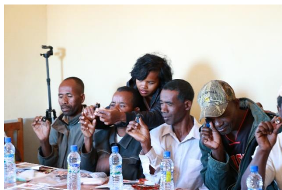
Formation en gemmologie simplifiée à Atsimo Andrefana

En outre, soixante (60) artisans miniers ont été formés à la gemmologie simplifiée pour mieux évaluer la qualité de leurs pierres précieuses, vendre leurs saphirs à meilleurs prix.