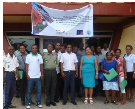
Atelier de redynamisation et de renforcement de capacité de la CER - Boeny

Quant à la Cellule environnementale Régionale (CER) de Boeny, elle est redynamisée. Ses membres ont bénéficié de renforcement de capacités en matière d'adaptation au changement climatique.