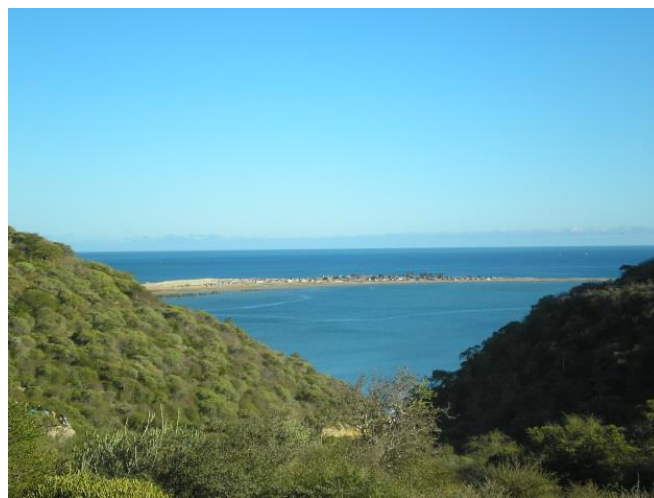
La Nouvelle Aire Protégée de Tsinjoriake

La réduction des menaces et des pressions sur la biodiversité, par le maintien de la couverture forestière et la régénération des zones dégradées des sites appuyés, concourt aux défis relevés pour la protection de l'environnement et conservation de la biodiversité au niveau international et national.