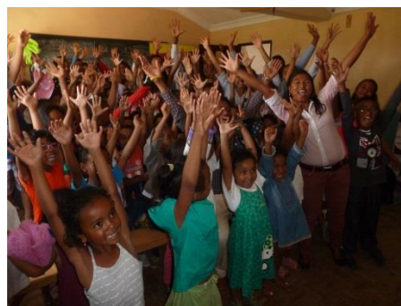
Sensibilisation sur l'adaptation au changement climatique lors de la Semaine de la Météorologie qui se déroulait en parallèle avec la COP 22 au Marrakech

De même, les acteurs clés au niveau national et régional profitent des cadres de concertation développés ainsi que des mécanismes d'intégration des questions environnementales et climatiques. En effet, leur compréhension commune des concepts utiles relatifs à l'adaptation au changement climatique a été développée et leur a permis d'intégrer les questions climatiques tant dans leurs instruments de planification que dans leurs activités de développement.