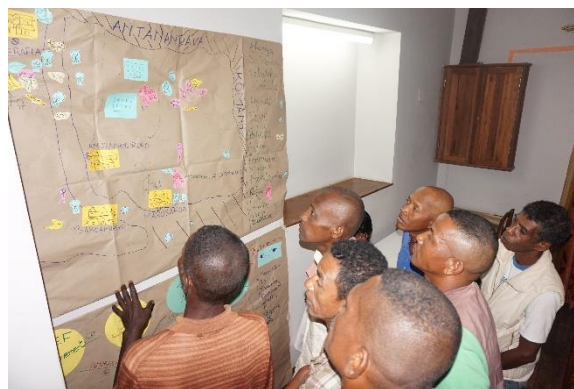
Atelier communautaire pour définir les grandes lignes du Protocole communautaire

leurs utilisations (APA) en vue de l'application du Protocole de Nagoya à Madagascar. Au niveau national, avec l'appui du PAGE, le MEEF est en train de mettre en place et de tester un mécanisme APA transitoire. Dans ce cadre, le Programme promeut l'élaboration du cadre réglementaire et institutionnel transitoire, le renforcement des capacités des acteurs pertinents, ainsi que l'accompagnement des cas relatifs à l'APA, la protection et la valorisation des connaissances traditionnelles relatives aux ressources génétiques.