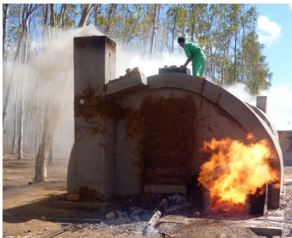
Production de charbon par la technique améliorée GMDR

Le PAGE/GIZ soutient également les analyses des situations, la mise en place et l'opérationnalisation des plateformes régionales d'échanges , en vue d'une communication intensive du thème sur l'énergie tirée de la biomasse auprès du "Grand Public". Des formations et/ou des conseils adaptés aux besoins des parties prenantes et des appuis aux initiatives adaptés sont offerts pour la planification régionale et l'élaboration des documents référentiels régionaux sur la biomasse ainsi que la réalisation des activités prioritaires. En outre, des expériences réussies de la filière bois énergie sont mises à l'échelle , à savoir : les technologies relatives aux meules améliorées de carbonisation par la Meule Améliorée à Tirage Inversé) ou MATI et/ou la meule à méthanisation GMDR « Green Mad Dome Retort), le système de production et commercialisation performant de foyers améliorés produits localement. Ces initiatives de mise à l'échelle sont accompagnées de transfert de connaissances et de savoir-faire liés à l'énergie de cuisson , à travers des formations spécifiques adaptées aux besoins des partenaires, des acteurs-clés. Par ailleurs des expérimentations d'autres technologies de transformation et de conversion plus performantes sont aussi menées.