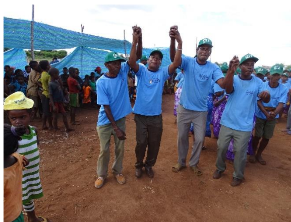
Ritualisation des signatures des contrats de gestion des forêts gérées par les 04 COBA à Antanimieva – Atsimo Andrefana

Parallèlement, le PAGE/GIZ offre des renforcements de capacités auprès des Services Techniques Déconcentrés (STD) et des groupes cibles sur des thématiques spécifiques liées à la GDRN.