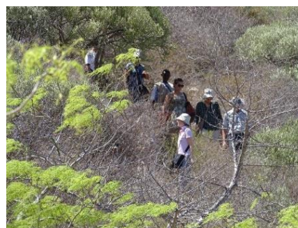
Visite du circuit touristique Moringa dans la NAP Tsinjoriake

La promotion des chaînes de valeur miel et tourisme dans et autour des aires protégées bénéficie environ 700 ménages et contribue à l'augmentation de leurs revenus, respectivement à hauteur de 18% et de 24,21% . Quant à la chaîne de valeur « Bois de construction d'œuvre et de service ou COS », la situation de référence à Boeny, Atsimo Andrefana et DIANA est établie.