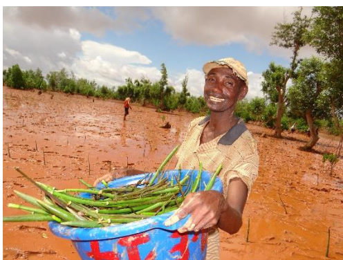
Restauration de mangroves à Boanamary – Boeny

En ce qui concerne l'Atsimo Andrefana, cinq techniques relatives à l'agriculture durable et résistante au changement climatique ( semis direct sous couverture végétale, utilisation du niébé à cycle court du Cajanus, Zaï / Basket Compost, agrofores-