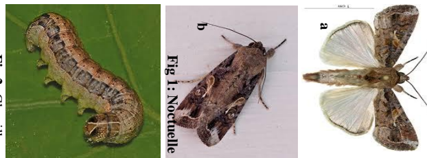
Fig. 2: Chenille

Cycle de vie : L'espèce a une durée de vie d'environ un mois, stade larvaire de 14 à 21 jours (fig.4). Les femelles peuvent pondre jusqu'à 1000 œufs chacune.