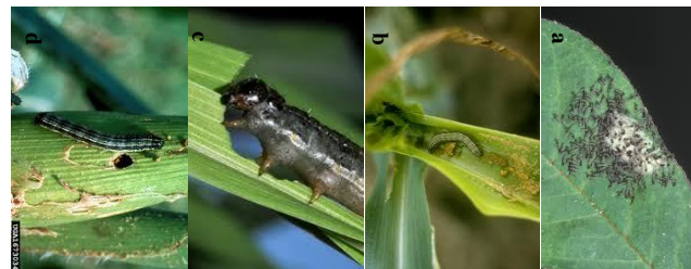
Fig. 3 : Feuilles attaquées par les chenilles